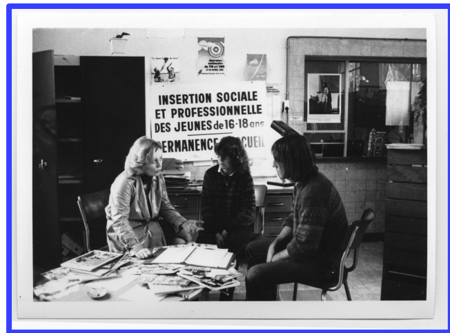
Un rendez-vous avant l'ouverture officielle de la mission Locale v. 1983.

Après cette période d'activité, le bâtiment devient un lieu de création et de spectacle vivant. Le théâtre Icare investit ainsi le bâtiment des anciens bains-douches en 1994.