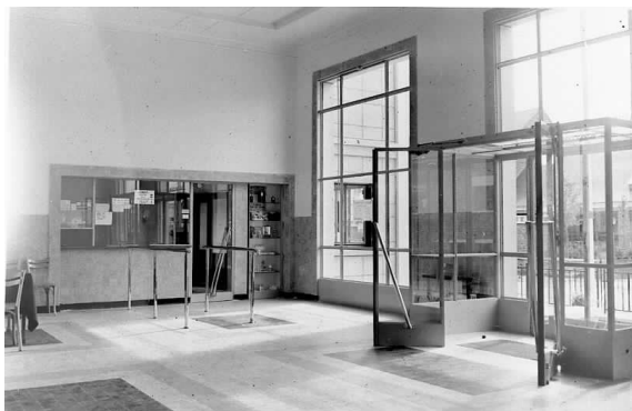
Vue de l'intérieur du bâtiment, 1953.

Pour répondre aux besoins sanitaires de la ville de Saint-Nazaire, des bains-douches sont construits dans le quartier de Méan-Penhoët en 1924. Les bains-douches rue d'Anjou ouvrent leurs portes à leur tour en 1927, mais sont malheureusement détruits par les bombes en 1943. Etant donné que le droit à l'hygiène figure parmi les priorités de la Reconstruction, disposer rapidement d'un nouvel équipement en complément de celui de Méan-Penhoët se présente comme indispensable. Il est donc décidé que les prochains bains-douches seront construits en centre-ville, rue de l'abattoir (aujourd'hui rue "des halles"). L'inauguration a lieu le 22 mars 1953. A cette époque, le bâtiment accueille en moyenne entre 700 à 750 douches et 70 bains par semaine. L'activité des bains-douches s'arrête en 1977.