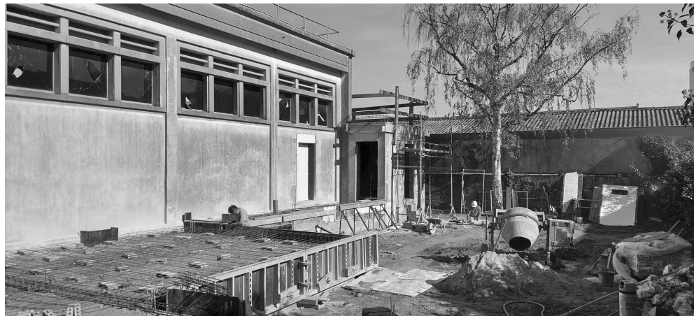
Construction de la terrasse 2020

Bien que des travaux soient nécessaires pour accueillir du public, conserver l'architecture originale du bâtiment issu du premier lot de la reconstruction, est indispensable. Le 8 mars 2021, Bain Public est inauguré et l'équipe peut commencer son activité !