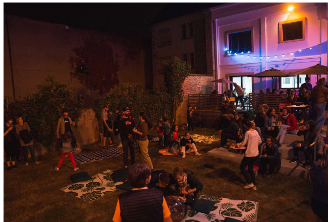
Jardin de Bain Public, fête de lancement 2021.