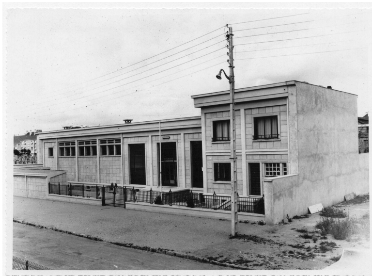
Vue de l'extérieur du bâtiment, 1953.

Les bains-douches rue des halles ont une architecture typique de la période de la Reconstruction. Le style post-Art déco est visible dans le jeu des volumes, des corniches, du dessin des baies et du revêtement du bâti en grandes dalles. La structure est dessinée et laissée apparente comme un élément du décor. Autre spécificité de l'architecture du bâtiment : la forme de ses ouvertures, plus larges que hautes.