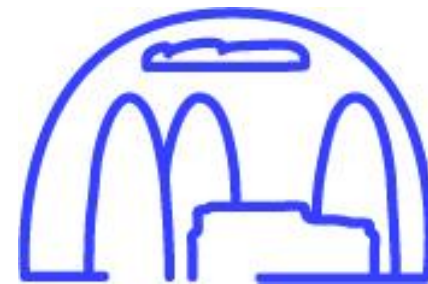
Picto de Bain Public, par Antonin Faurel, 2020