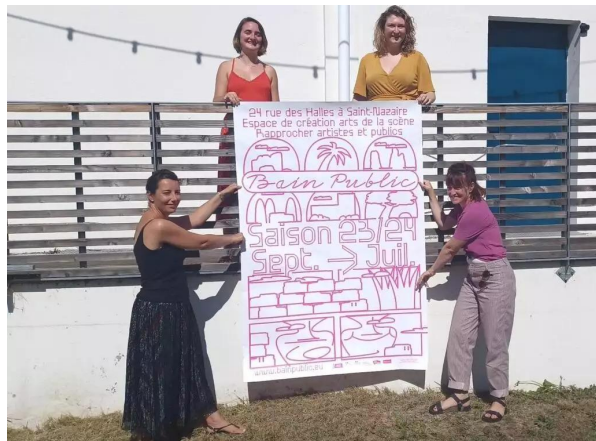
Présentation de la saison 2023